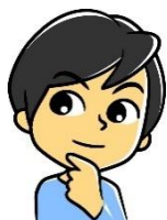
中央 西子 CM

身体機能、身体状態の経時的変化を客観的に示した LIFE のフィードバックはケアマネジメントに必要な視点です。ケアマネジャーにはまだ馴染みが薄い LIFE 。「科学的介護の視点」を持ったケアマネジメントができるよう、今、一緒に学んでおきましょう。